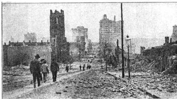
THE GREAT EARTHQUAKE AND FIRE, SAN FRANCISCO, CAL., 1906. LOOKING DOWN CALIFORNIA STREET FROM NOR HILL.

cartes, de tous les coins du globe. Cela me confirme mes convictions: la carte postale pourrait pacifier le monde car elle permet de communiquer.