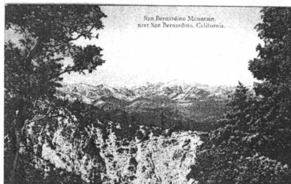
Les montagnes de San Bernardino, en Californie